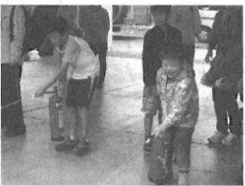
水消火器取扱体験の様子