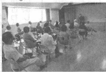
防火・防災講話の様子

平成二十五年六月二十九日(土)に大谷市民センターにて、平成二十四年度・平成二十五年年度「住宅防火・防災モデル地区」に指定されている大谷第二地区市民防災会を対象に防火・防災研修会を開催いたしました。