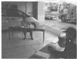
119番通報体験の様子

その後、避難所での手続き等について、区役所職員から説明を受けた後119番通報体験、煙内通過体験、水消火器取扱体験、地震体験を実施し、災害時の基本的な動作を学ぶことができました。今後は、実災害時に機能するような自主防災組織作りをめざして、マンネリ化しないように継続して訓練等を実施していきます。