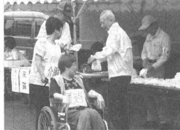
車椅子を使用している訓練の様子

平成二十五年六月二十三日(日)に飛幡中学校において、例年、実施されている南沢見地区市民防災会及び自治会主催の防災訓練が実施されました。訓練では、車椅子を使用した参集訓練等を行うと共に実災害時の役割分担を確認しました。また、社会福祉協議会がアルファ米を使用した炊き出し訓練も行いました。