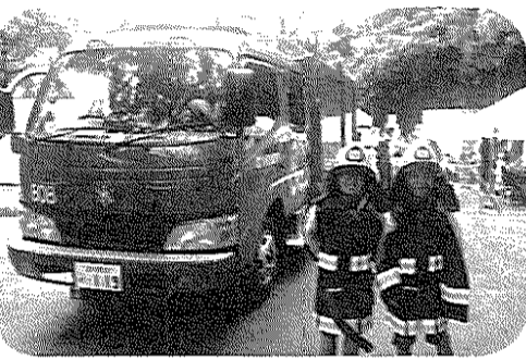
子供用防火服に身を包んで気分は消防士！

あいにくの雨模様ではありましたが、ステージ上では、2日間にわたり歌やバンド演奏、ストリートダンス等が披露され、会場は来場者からの大きな拍手に包まれていました。